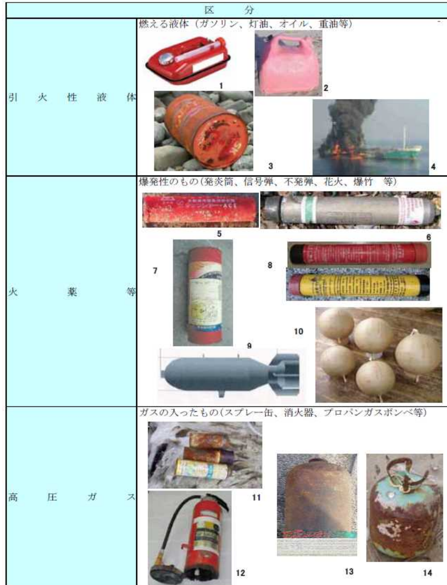
表 1.3(1) 危険物種別表