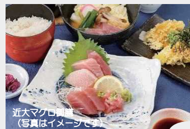
近大マグロ御膳 (写真はイメージです)

熊野御坊南海バスホームページからお申込みください。 受付開始日: 2022年7月19日 (火) 9:00 (予定) https://kumanogobobus.nankai-nanki.jp