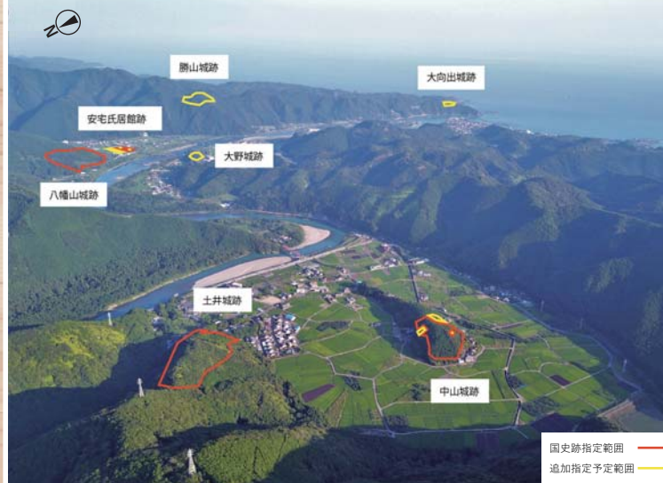
安宅氏城館跡(国史跡指定範囲)

このように自然の中で、昔も今も大地の恵みを受けながら私たちは大地と共に生きています。