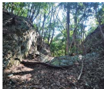
八幡山城跡の岩盤掘切