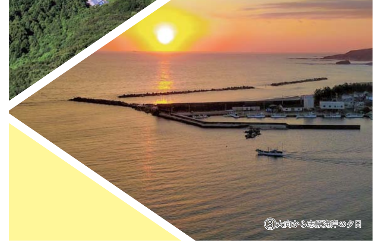
③大向から志原海岸の夕景