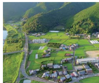
安宅本城跡と八幡山城跡

日置川流域は、中世時代の熊野水軍領主として活躍した安宅氏が支配する地で、河口から上流約5km以内に7カ所の城を構築しています。又、海上交通を支配し、造船や材木・備前焼などの流通に関わり、大きな富を蓄積していたようです。