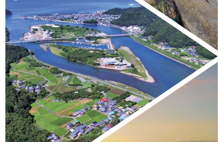
②日置川河口域と中州