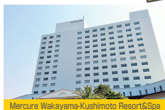
Mercure Wakayama-Kushimoto Resort&Spa