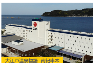
大江戸温泉物語 南紀串本