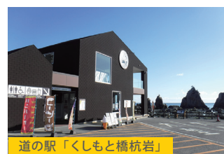
道の駅「くしもと橋杭岩」