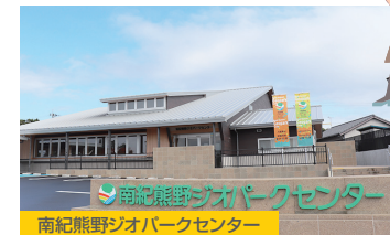
南紀熊野ジオパークセンター

潮岬観光タワーで太平洋のパノラマを一望。レストランでは絶品ランチを満喫。南紀熊野ジオパークセンターでは、迫力ある映像や実験装置で、大地の成り立ちを楽しみながら学ぶことができます。