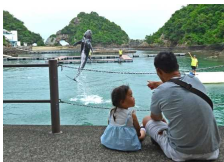
「くじらとの出会い」