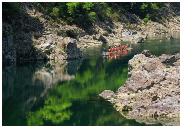
「清流筏下り」 鈴木 文代 様(串本町) 撮影場所 北山村