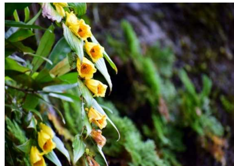
「山里の貴婦人(キイジョウロウホトギス)」