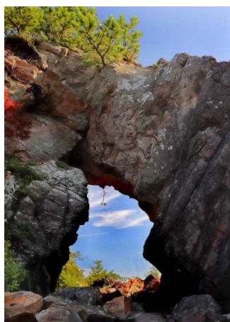
あすのぞ 「明日へと覗む」