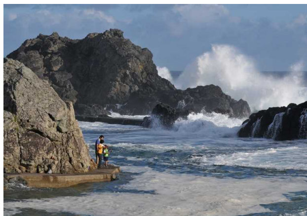
「台風襲来」 石川 昭春 様(串本町) 撮影場所 串本町