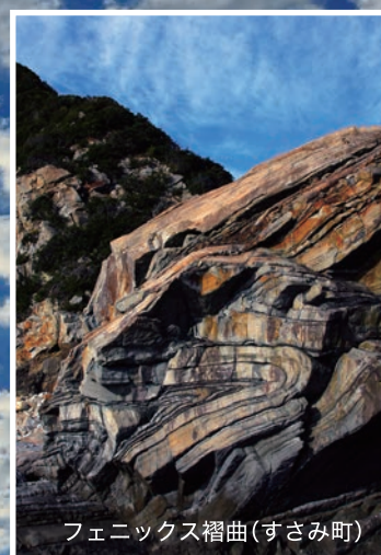
フェニックス褶曲(すさみ町)