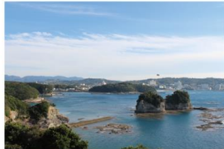
⑧番所山公園（展望塔）