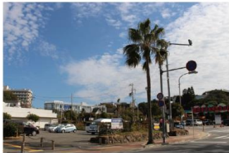
①しらはまゆう公園