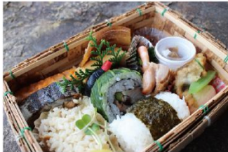
ジオ弁当 in 白浜