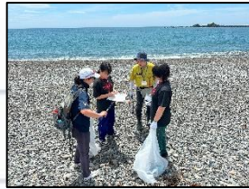
写真2 ごみの回収作業