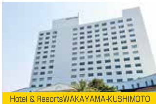
Hotel & Resorts WAKAYAMA-KUSHIMOTO