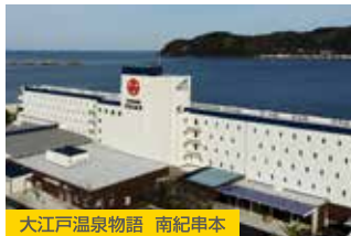
大江戸温泉物語 南紀串本