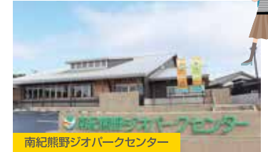
南紀熊野ジオパークセンター

潮岬観光タワーで太平洋のパノラマを一望。レストランでは絶品ランチを満喫。南紀熊野ジオパークセンターでは、迫力ある映像や実験装置で、大地の成り立ちを楽しみながら学ぶことができます。