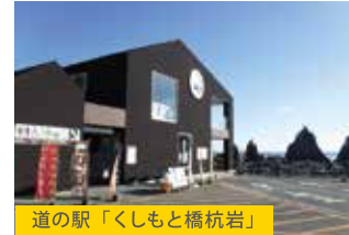
道の駅「くしもと橋杭岩」