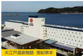
大江戸温泉物語 南紀串本