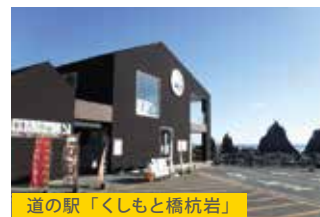
道の駅「くしもと橋杭岩」