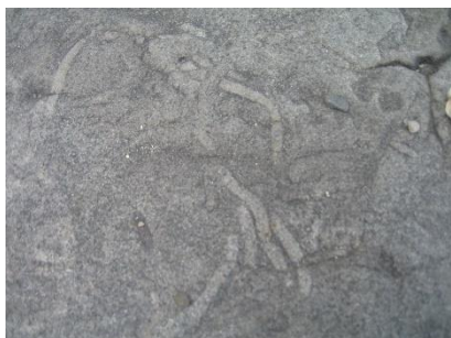
シガラミ磯の化石

10:55 白浜駅発 10:59 紀伊富田駅着 15:42 紀伊富田駅発 15:45 白浜駅着